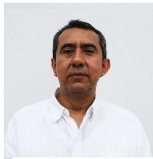
Mtro. Jorge Montaña Ventura

Fiscal Especializado en Delitos Electorales del Estado de Tabasco